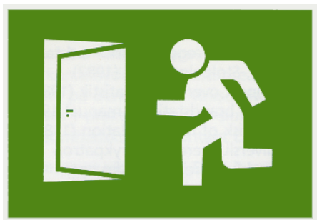
Fig. 1: Flugtvejsskilt

Flugtvejsskilt: Et sikkerhedsskilt (se fig. 1), som giver anvisning vedrørende nødudgange og flugtveje. Skiltet er grønt med piktogram og skal opfylde Arbejdstilsynets bestemmelser om sikkerhedskiltning i bekendtgørelsen om sikkerhedskiltning og anden form for signalgivning.