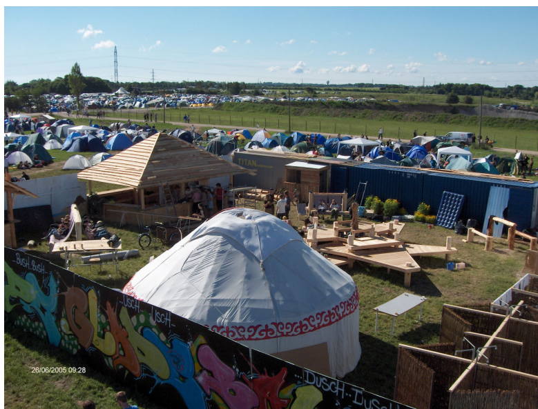
Fig. 2: Eksempler på konstruktioner udført af brændbart materiale, der kræver kommunalbestyrelsens godkendelse